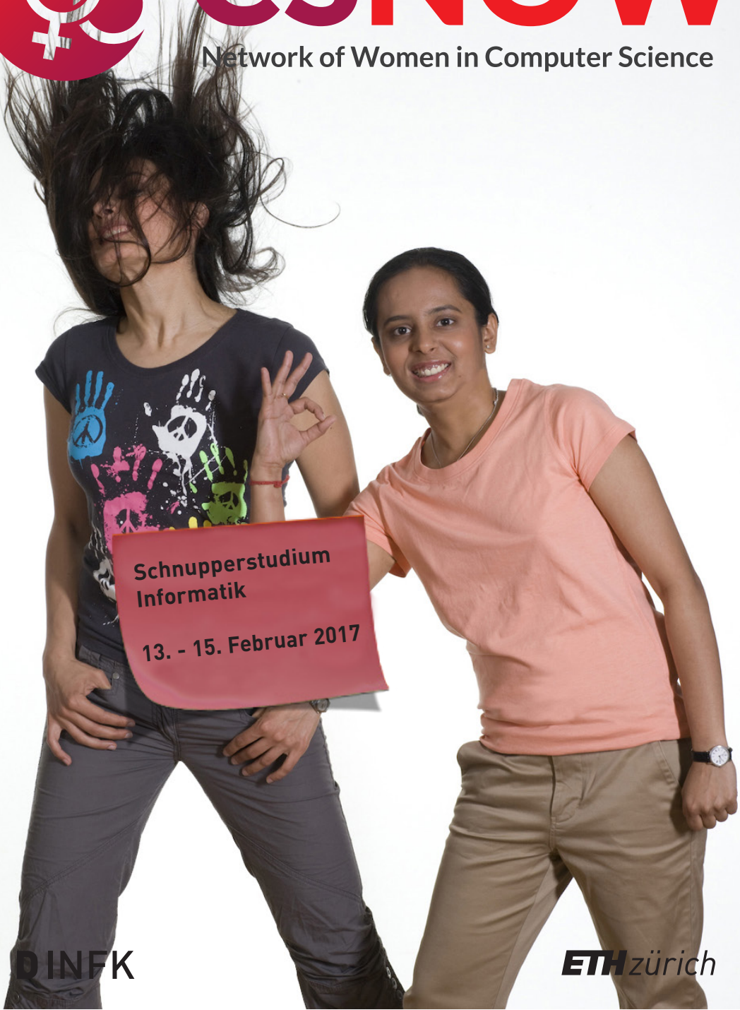
Foto: Tahmineh und Ramya studieren beide Informatik an der ETH